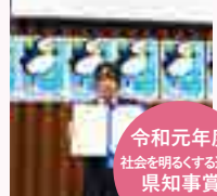
令和元年度 社会を明るくする運動 県知事賞受賞！

チャレンジ類型では、国公立大学でも通用する力をつけるための授業設定となっています。また、推薦入試やAO入試において必要となる論理的な思考力や表現力を身につけられるよう対策しています。10名前後の少人数のため仲間と対話しながら勉強しています。