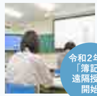
令和2年度 「簿記」遠隔授業開始

ベーシック類型では、「情報」、「商業」科目が選択でき、WordやExcel、PowerPointなどのソフトの使い方を学習し、資格取得を目指します。第2学年では「簿記」を和田山高校との遠隔授業で学ぶことで、全商簿記検定を取得し、即戦力の社会人となることを目指します。