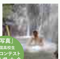
「写真」全国高校生写真コンテスト 兵庫県大会 出場

アクティブ類型では、専門家の指導を受けることができます。教科「アクティブ」ではゴルフやスキー、木工や写真など人生を豊かにするための専門的な技術を身につけます。また、普通教科では基礎基本からゆっくり、しっかりと学ぶことができるため勉強が苦手な人も安心です。